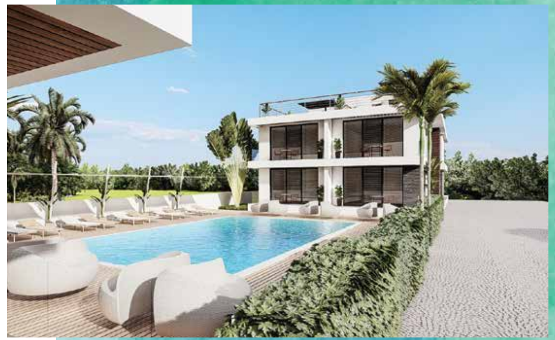
Kullanılan görseller temsilidir.