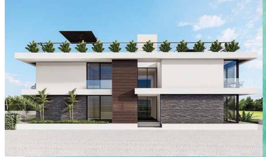
Kullanılan görseller temsildir.