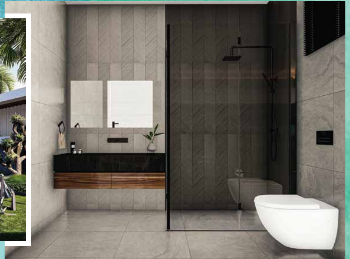
Kullanılan görseller temsildir.